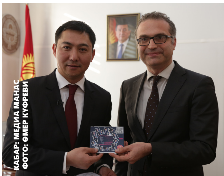
КАБАР: МЕДИА МАНАС

Кыргыз-Түрк “Манас” университетинин (КТМУ) Медиа Борборунун “Медиаманас” тарабынан 2018-жылдын 30-31-декабрында “Айтматовду окуйбуз” долбоору ишке ашырылды.