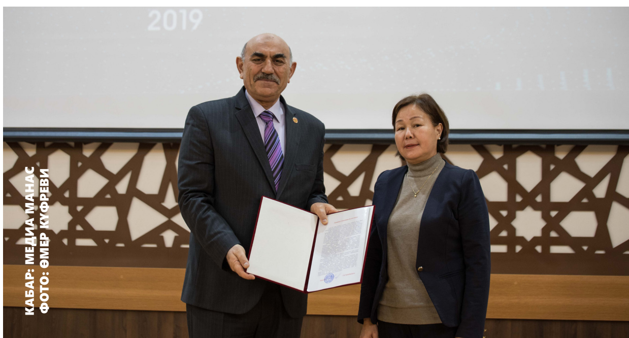
КАБАР: МЕДИА МАНАС

Ректор проф., докт. С.Балжы окуу жайыбыздын бир катар жетишкендиктерин айтып келип, буларга токтолду: ““Манас” университети эки ураан менен иштеп, жашап келгенин эстен чыгарбайлы. 2010-жылы окуу жайыбызга ишкежаңыдан киришкенимде, университетибиз бир да бир урааны жок иштеп жаткан экен. Ошондо эки маанини туюндурган ураанды тандап ишке киргиздик. Анын бири – жашоо үчүн “тынчтык климаты” деген ураан эле, чындыгында жамаат ичинде тынчтык болбосо, иш алдыга жылбайт эмеспи. Ал эми экинчиси – “келечек колубузда” деген ураан болду. Бул ураандар жөн жерден коюлган жок, а иштеги максатыбызды аныктаган негиз болуп берди. Ийгиликке жетүү үчүн эң башкысы каалоо керек. Кааласак, баары колдон келет. Каалоо болгон жерде, бүтпөгөн иш болбойт. Алдыда дагы көп бийик максаттарыбыз бар. Аларды ишке ашыруу үчүн үчүн тынчтык өкүм сүргөн ынтымакта, сүйүү,