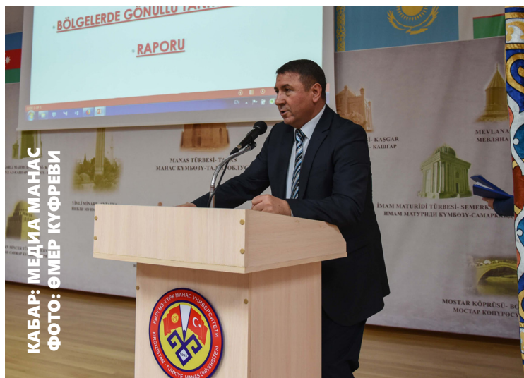
КАБАР: МЕДИА МАНАС ФОТО: ӨМӨР КУФРЕВИ

Кыргыз-Түрк «Манас» университетинин (КТМУ) Таанытуу комиссиясынын жетекчилигинде Студенттердин иштери боюнча башкармалык (СИББ) менен Студенттик Кеңеш Кыргызстандын 7 облусунда «Аймактарда таанытуу иш-чараларын» уюштурду.